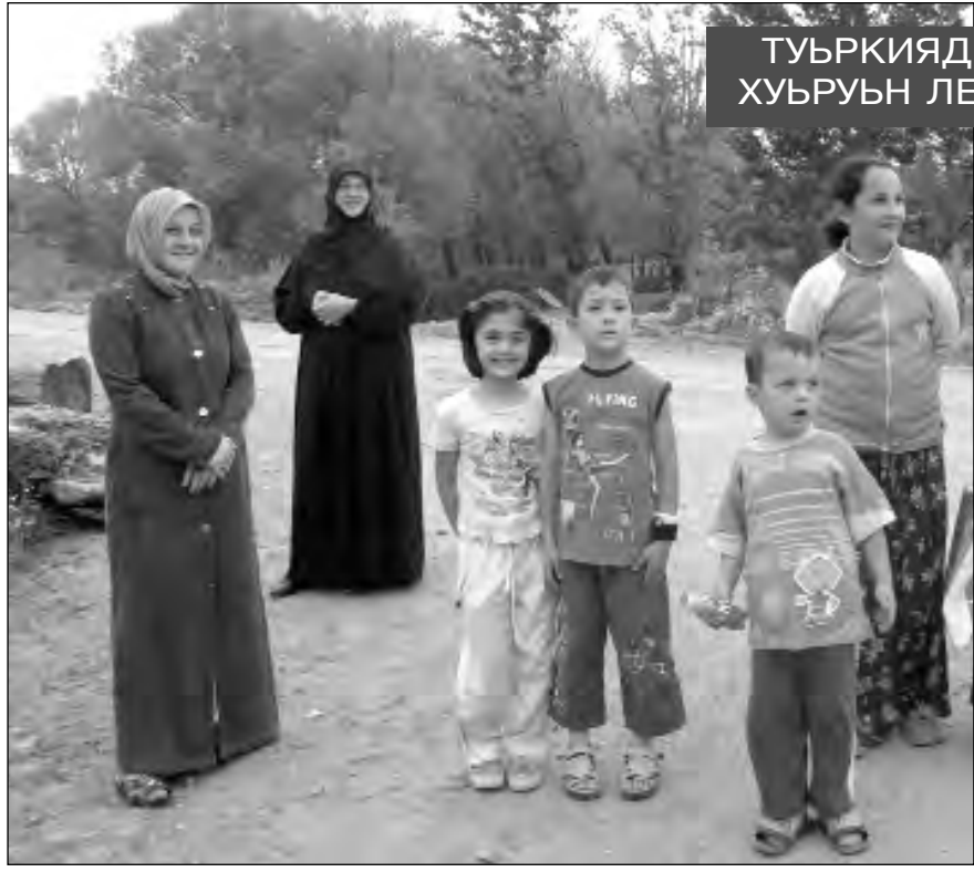
ТУРКИЯДИН КИРНЕ ХУЬРУЬН ЛЕЗГИ АЯЛАР

• 1788-йисан октябрдин вацра Абд ал-Хая чин куьчарнавай, Ахцегъай жагъанвай хронографда лезгийрин XVIII виш йисан тарихдиз талуьк гзаф къиметлу делилар гъатнава. Ина лезгийри урус чапхунчийрин аксина чӀугур женгерикайни кхъенва. 1729-1730-йисара Бут хуьруьн ва маса хуьрерин агъалийри абурухъ галаз къати женгер чӀугунай. 1730-1731-йисара урус пачагъдин къушунри Куьре вилайатдин Испик, Салиян ва Шандакъ хътин чӀехи лезги хуьрер цӀай яна канай.