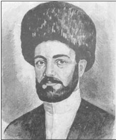
Е Т И М Э М И Н

Къвед лагъайди, халкъдин рикі алай шаиррин гзаф шиирар манийриз элкъвенва. Амма бязи инсанриз и манийрин аваз чизватлани, члалар хуралай чизвач. Ингье абуруз гъа члалар чириз кланзава. Гъа и къве кар себес яз агъадихъ чна чи классикрин хкъанавай шииррикай туькълурнавай чин гъзва.