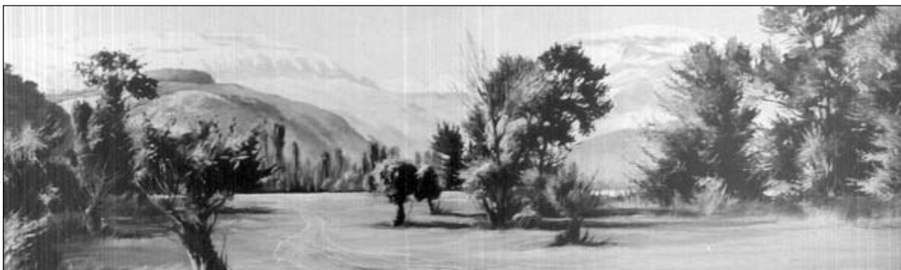
Тивар-ван авай кцарви художник Руюстембег Нагъиева хайи чилин пейзажар члехи устадвилелди члугвазва. Ингье а пейзажрикай сад - "Къарабулахдин рехъ".