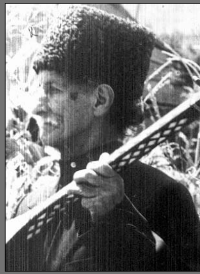
AŞIQ ŞƏMŞİR - 110

Delidağın görüşünə qonaq gəl, İstisuya müqəddəs de, pir, isin.