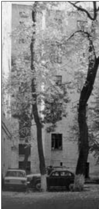
Payızın bir anı