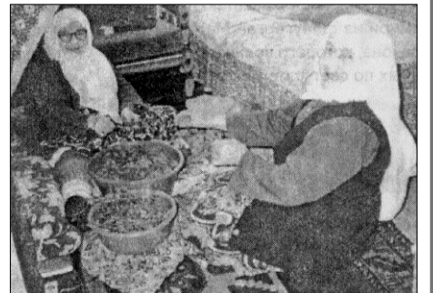
Лезгинки в Турции за приготовлением афарар

Какая бывает радость, люди, вы знаете? Если не знаете, спросите меня. Такая тяжкая чужбина бывает ли?.. Мы в бессилии оставались, связанные